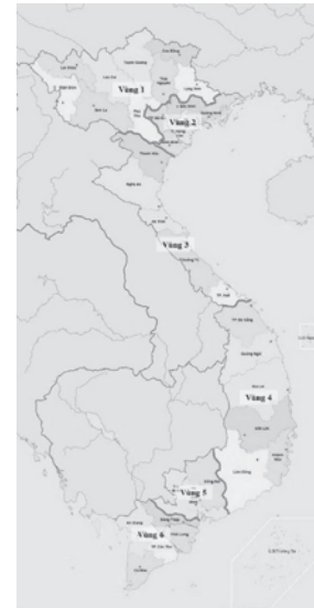
Hình 3. Dự kiến phương án điều chỉnh phân vùng - Các tỉnh, thành phố tạo vùng và diện tích dân số năm 2024. (Bảng 1)