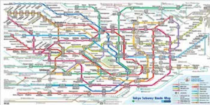
Hình 2. Hệ thống tàu điện ngầm tại Tokyo, Nhật Bản

Canada nổi tiếng với kinh nghiệm sâu rộng trong phát triển và quản lý các hệ thống kết nối tầng hầm và không gian ngầm đô thị, đặc biệt tại các thành phố lớn như Toronto và Montreal. Đây được xem là một giải pháp hiệu quả nhằm thích ứng với điều kiện thời tiết khắc nghiệt, quỹ đất hạn chế và nhu cầu giao thông ngày càng gia tăng. Tại Canada, các ga tàu điện ngầm thường được lựa chọn làm hạt nhân của hệ thống kết nối không gian ngầm. Việc sử dụng các ga tàu điện ngầm làm điểm kết nối cốt lõi góp phần hình thành mạng lưới giao thông ngầm hiệu quả, đồng thời khuyến khích người dân sử dụng phương tiện GTCC. Các lối đi ngầm không chỉ đóng vai trò giao thông đơn thuần mà còn được tích hợp nhiều chức năng như mua sắm, ăn uống, giải trí và văn phòng, tạo nên một “thành phố dưới lòng đất” với các hoạt động đa dạng. Việc phát triển không gian ngầm đòi hỏi tầm nhìn chiến lược và quy hoạch tổng thể, đồng thời cần được tích hợp chặt chẽ với quy hoạch đô thị trên mặt đất. Điển hình là mạng lưới đường ngầm PATH tại Toronto, Ontario (Canada), có chiều dài hơn 30 km (18 dặm) dành cho người đi bộ. Hệ thống này kết nối trực tiếp với hơn 70 tòa nhà văn phòng, 6 khách sạn lớn cùng hàng nghìn cửa hàng, nhà hàng và các dịch vụ khác. Đồng thời, mạng lưới PATH cũng liên thông với hệ thống tàu điện ngầm của Toronto Transit Commission (TTC) và nhà ga xe lửa Union Station (một trong những trung tâm giao thông lớn nhất Canada).