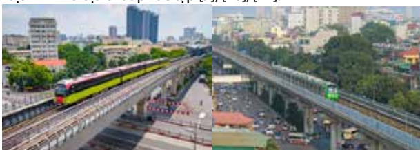
Hình 1. Các tuyến ĐSĐT đã đưa vào khai thác tại Hà Nội

Tàu điện ngầm, là phương tiện vận tải hành khách mà cơ sở hạ tầng (đường sắt) phần lớn được đặt ngầm dưới mặt đất, không có giao cắt với đường bộ hoặc với phương tiện vận tải khác. Tàu điện ngầm được xây dựng ở tại các thành phố có quy mô dân số > 1 triệu dân, có công suất luồng hành khách từ 12.000 - 60.000 người trong một giờ theo 1 hướng vào giờ cao điểm. Tàu điện ngầm có các ưu điểm như tiết kiệm đất đai xây dựng cho thành phố; giải quyết được ách tắc giao thông do điều tiết được khối lượng và mật độ phương tiện, đảm bảo cảnh quan môi trường; tốc độ giao thông cao. Tuy nhiên, tàu điện ngầm cũng có hạn chế là yêu cầu vốn đầu tư rất lớn, đặc biệt tại những khu vực có điều kiện địa hình và địa chất phức tạp [9], [10], [11].