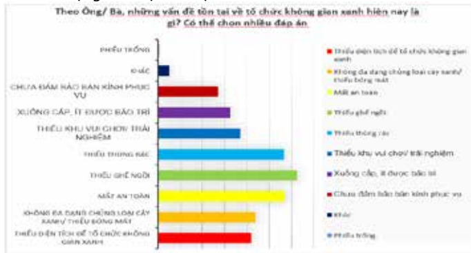
Hình 1. Phiếu khảo sát thu thập tại địa bàn phường Chương Mỹ