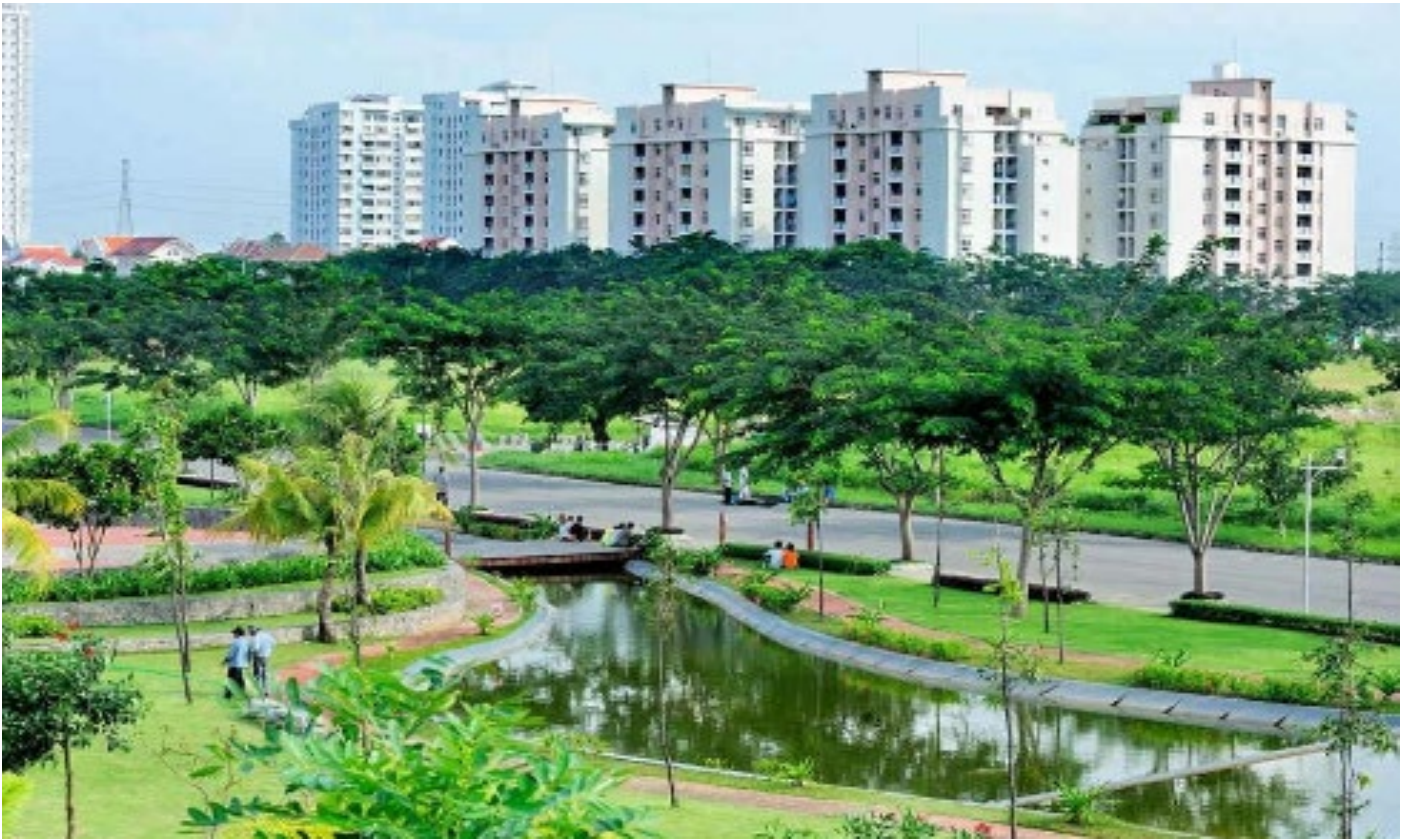
Hình 1. Một ví dụ về tạo dựng môi trường sống tốt hơn dành cho cư dân trong thiết kế đô thị mới và thiết kế đô thị cải tạo và hoàn thiện đô thị hiện hữu.

- Cần đặc biệt tránh bệnh sơ lược trong quy hoạch dẫn đến sự nghèo nàn trong cấu trúc và tổ chức không gian các khu đô thị mới cũng như cũ, nơi chúng bị giản lược hóa đến mức vừa xây xong đã có nhu cầu cải tạo hoặc bổ sung. Nói chung, ở nước ta, các dự án quy hoạch thường duy ý chí, minh họa các chủ trương nhất thời, thay vì những bài tính quy hoạch đô thị đích thực. Điều này dẫn đến tính phi thực tế và bất khả thi của quy hoạch đô thị ra khỏi tầm kiểm soát. Chúng thiếu các không gian công cộng phân chia thành tầng bậc, thiếu các quảng trường và điểm nhấn kiến trúc cảnh quan, thiếu những hình thức kiến trúc góp phần tạo nên tiện nghi và diện mạo thành thị. Trong nhiều trường hợp nó trở thành nơi cư trú và nơi nghỉ ngơi, hoặc nơi sản xuất, ...theo một cách thuần túy. Về phương diện nào đó, các đô thị mới hay cũ, mà chủ yếu là ở trong các khu các đô thị mới, đang mang trong mình sự lỗi thời và mảm mống của những mâu thuẫn.